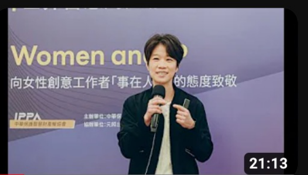
剪輯創作之理性與感性 by 蘇珮儀_2023/4/26世界智慧財產權日在臺灣 觀看次數：19次 · 6個月前