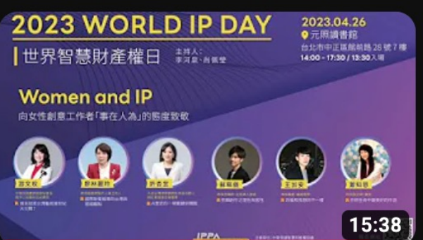
從「風馬牛不相及」到「萬事都互相效力」_2023/4/26世界智慧財產... 觀看次數：10次 · 6個月前