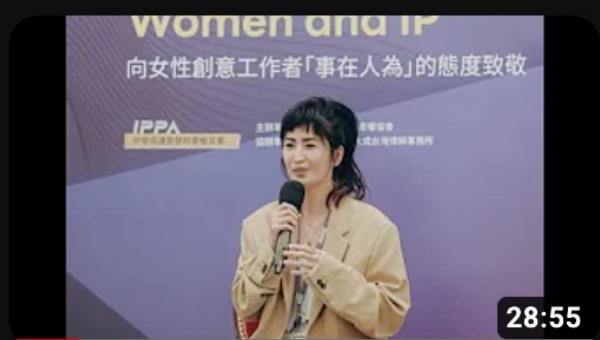
從工作到創作：作妳生命中最美好的作品 by 蕭知恩_2023/4/26世界智... 觀看次數：35次 · 5個月前