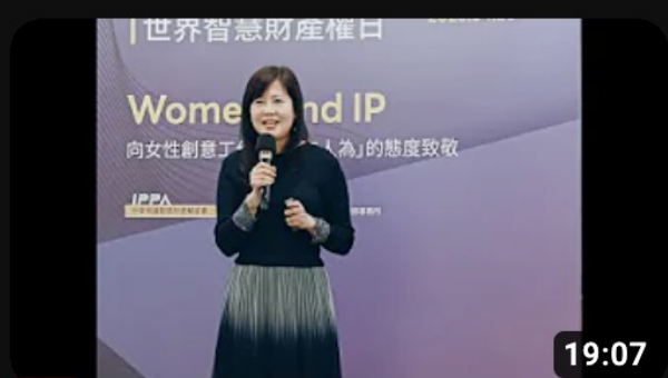
誰來拯救台灣藝術圈世紀大災難? by 游文玫_2023/4/26世界智慧財產... 觀看次數：10次 · 6個月前