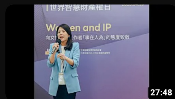
AI歷史的一場關鍵併購戰 by 許杏宜_2023/4/26世界智慧財產權日在... 觀看次數：102次 · 5個月前