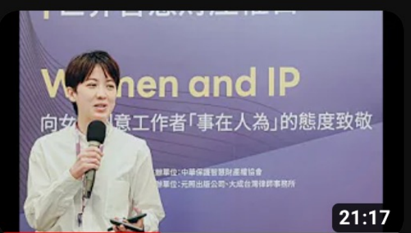
改編和我想的不一樣 by 王加安_2023/4/26世界智慧財產權日在臺灣 觀看次數：30次 · 6個月前