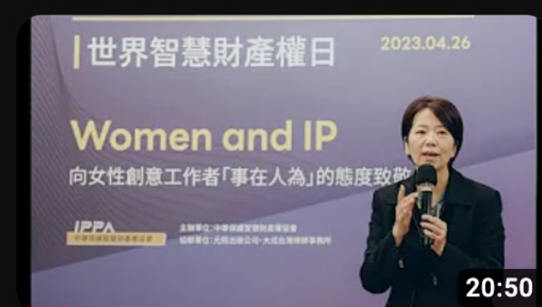
國際新聞報導的台灣與德國觀點 by 廖林麗玲_2023/4/26世界智慧財... 觀看次數：10次 · 6個月前